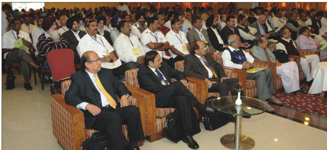
IYC National Conference of ARDBs-A view of participants.