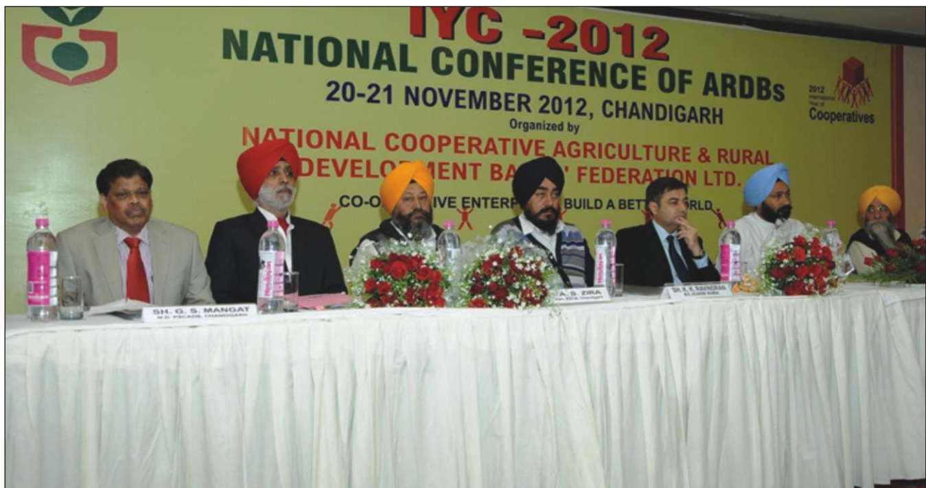
IYC National Conference of ARDBs-A view of the Dias on the first day.